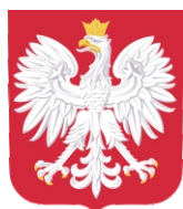
Anna Krupka Minister Sportu i Turystyki